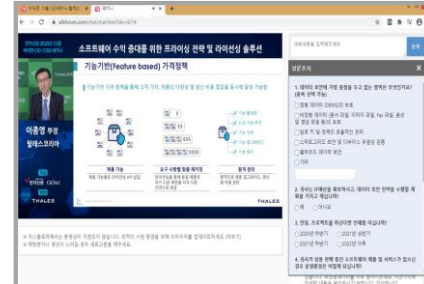
설문지 배포 및 회수